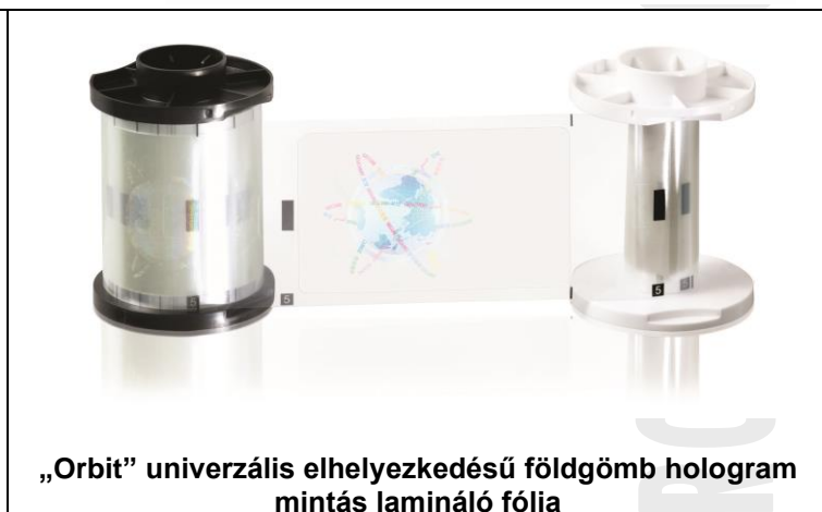
„Orbit” univerzális elhelyezkedésű földgömb hologram mintás lamináló fólia