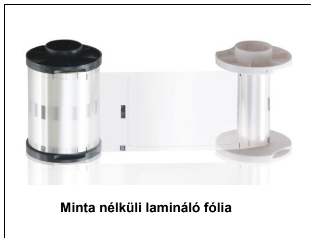
Minta nélküli lamináló fólia